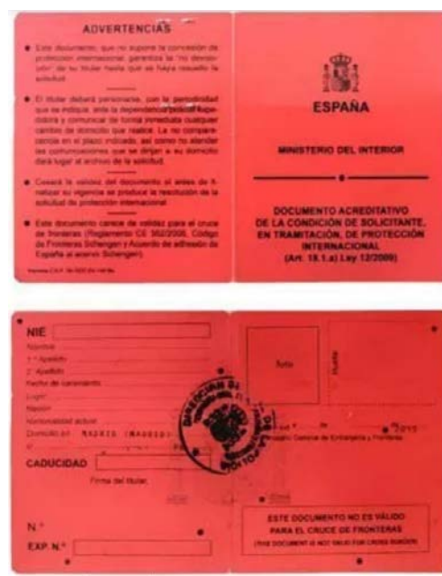
Figura No. 3

Este documento y los posteriores tendrán una validez de 6 meses y deberás ir renovándolos de la misma manera hasta que haya una resolución de tu solicitud de asilo. La tarjeta roja menciona que “No es válido para el cruce de fronteras”, lo que significa que no puedes abandonar España (tampoco viajando dentro de Europa.)